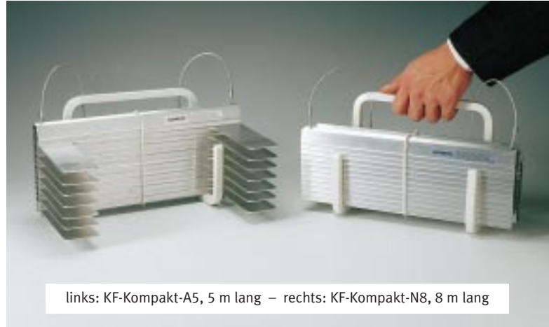
links: KF-Kompakt-A5, 5 m lang – rechts: KF-Kompakt-N8, 8 m lang

»KLETTER-FIX« Die kleinste Rettungsleiter der Welt